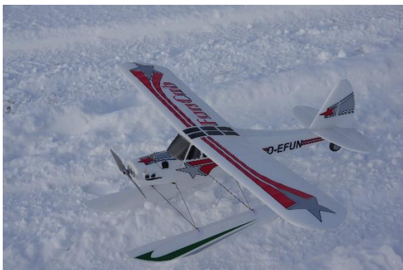
En utmärkt lösning för att starta och landa på snö eller vatten.