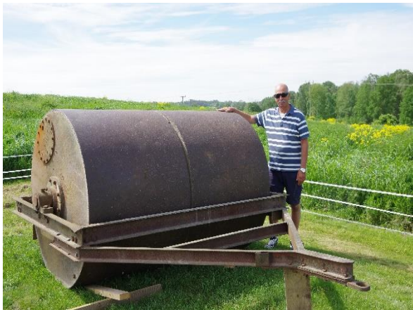
Välten har vi på "långlån" från NGK