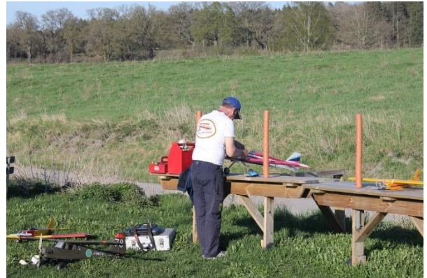
Tur för våra gamlingar att vi inte längre behöver krypa på knä!