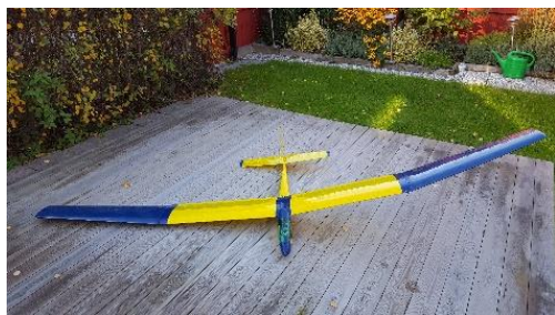
Utan motor i original