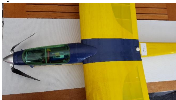
Så blev den med huvan på, snyggt va!

Ovan, motorinstallation och kylflutintag på RCM- modellen "Paragon". Futaba 27 Mhz radion byttes mot Hitech 7 kanal och nya servon. Linkroks mekanismen behövs.